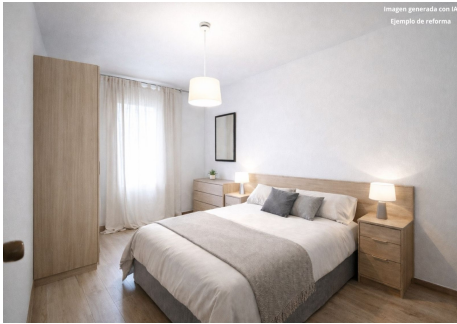
Imagen generada con IA (Ejemplo de reforma)