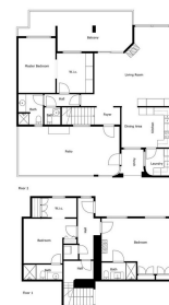
Measurements Calculated Are Deemed Highly Reliable But Are Not Guaranteed