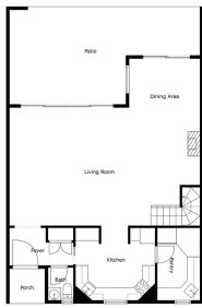
Measurements Calculated and Deemed Highly Suitable, But are Not Guaranteed