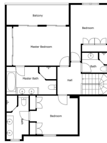
Measurements Calculated and Deemed Highly Suitable, But are Not Guaranteed