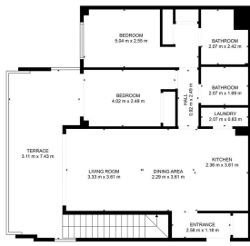
NIVEL 0 m 2 SUPERFICIE ÚTIL: 50,10 m 2 (50,10 m 2 ) INCLUIDO EN EL TERRENO: 10 m 2 (10,00 m 2 )