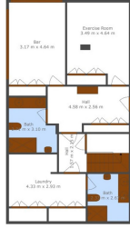
TOTAL 281 m 2 Neto Covered: 274.20 m 2 (100%) EXCLUDED AREA: COVERED TERRACE: 6.80 m 2 (2.4%) EXCLUDED: 0.00 m 2 (0%)