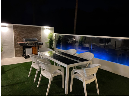
GROUND FLOOR Planta Baja