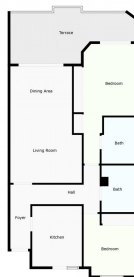
For Illustrative Purposes Only. May Vary Due To Property To Suite.