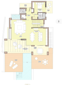
GROUND FLOOR PLANTA BAJA