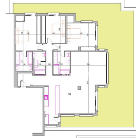
PROYECTO: REFORMA DE APARTAMENTO HOTEL DEL GOLF - C/ LONDRES, S/N - LAS BRISAS MARBELLA - MÁLAGA