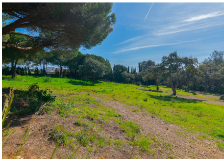
Los altos de Valderrama - Sotogrande