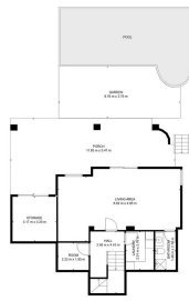
VILLA ONE 012 HOUSE MODEL: 012 - PLAN 3.03 (1/20) EQUIPMENT: OVEN, REFRIG., DISHWASHER, T.V., SINK, STOVE, W.C., BATH, B.B.Q. TERRACE: 86 sq. METERS AREA - FULL, COVERED 36 sq. METERS