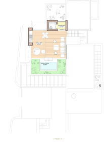
BASEMENT PLANTA SOTANO